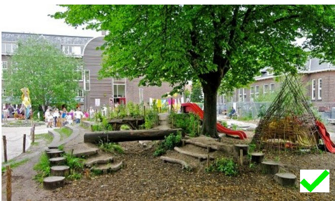
Speelaanleiding = wel subsidiabel