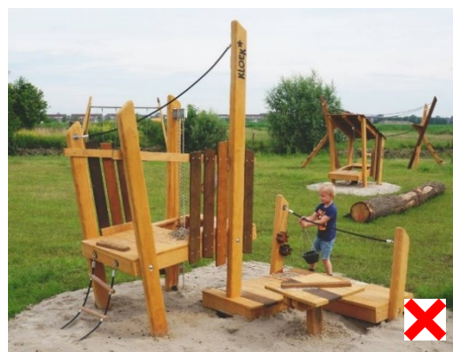
Speeltoestel = niet subsidiabel