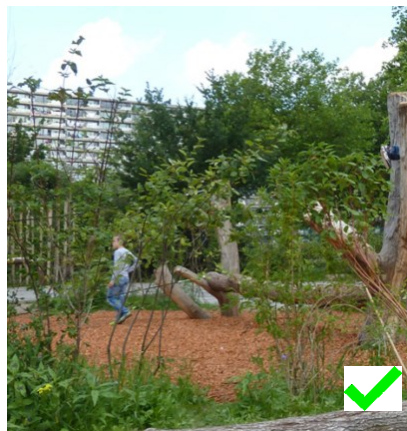
Onthard oppervlak (natuurlijk)